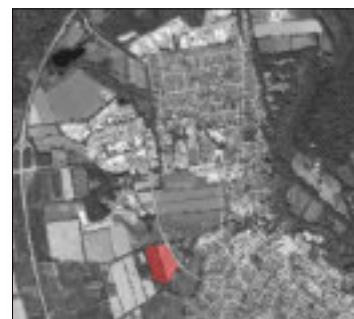
Der geplante Standort des Rettungszentrums an der Gadebuscher Straße (rot)

Es sind keine einfachen Planungen, da z.B. Lärmemissionen und Naturschutzbelange sorgfältig abgewogen werden müssen. Zudem müssen mit dem Innen- und Finanzministerium (Polizei) und dem Kreis (Rettungsverbund Stormarn) unterschiedlichste Akteure handeln und zusammengebracht werden. So hat die Gemeinde einen ersten großen Schritt hin zu einem Rettungszentrum gemacht, es ist jedoch aktuell nicht absehbar, wie lange es dauern wird, bis dort die ersten Gebäude stehen.